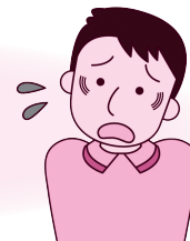
(消費者庁イラスト集より)