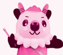
もシカっち 長野県消費者 被害防止啓発キャラクター