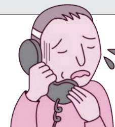
(消費者庁イラスト集より)

国民生活センター 新型コロナワクチン詐欺 消費者ホットライン ☎ 0120-797-188