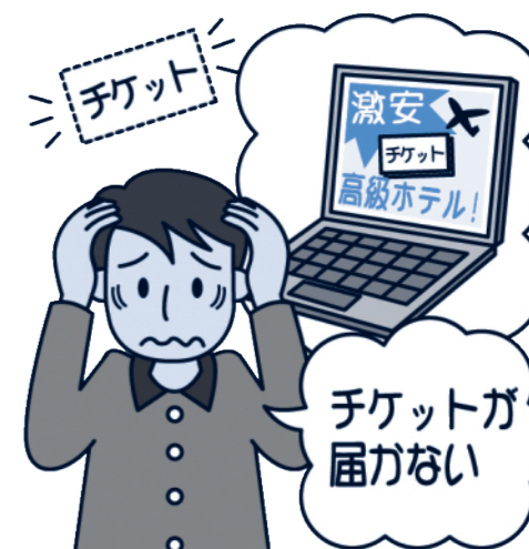
(消費者庁イラスト集より)