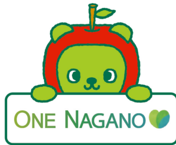
台風19号災害への義援金・寄付付き商品「ONE NAGANO」×「アルクマ」ロゴ

自然災害にあった地域などで作られた商品を購入することで、その地域を応援することができます。