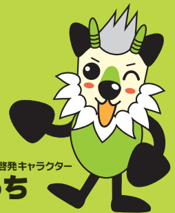
長野県消費者被害防止啓発キャラクター もしかっち