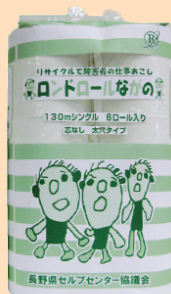
トイレトペーパー