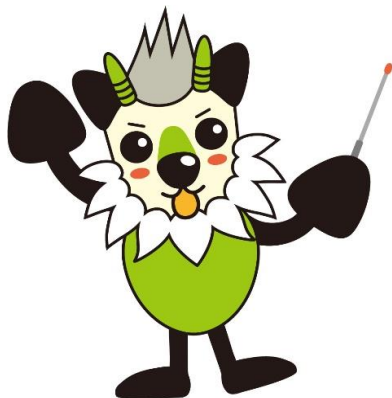
長野県消費者被害防止啓発キャラクター もシカっち

学校現場での模擬授業の実践 学校での教員研修会等の講師 教員の他に児童・生徒や保護者を含めた講演会等の講師 地域単位での教員を対象とした研修会等の講師 など