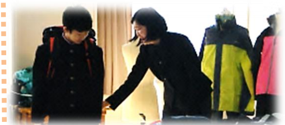
【サンプル商品で使い易さを比べて考える】