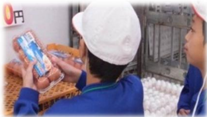
【店舗に出かけ、商品を購入する】