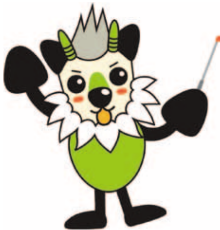
長野県消費者被害防止啓発キャラクター もシカっち