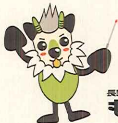
長野県消費者被害防止啓発キャラクター もしかっち

※詳しくは、長野県消費生活情報のホームページ をご覧ください。 http://www.nagano-shohi.net/