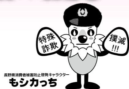
長野県消費者被害防止啓発キャラクター モシカッチ

家族や金融機関、コンビニ従業員などによる被害阻止件数が大幅増! 身近な方への声かけで、高額な被害防止につながっています。