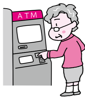
「ATMを操作」して戻る 還付金は絶対にありません!