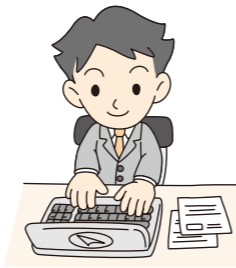
会社で働く 雇用契約