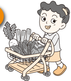
スーパーで野菜を買う 売買契約