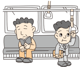
電車、バスに乗る 運送契約