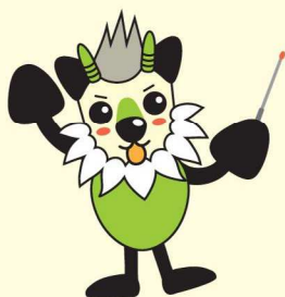
長野県消費者被害防止啓発キャラクター